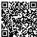
QR-Code zu den Nutzungsbedingungen

Die Nutzungsbedingungen und die Datenschutzerklärung von LOGINEO NRW LMS finden Sie unter den folgenden Links. Ausgedruckte Versionen der Dokumente erhalten Sie im Schulsekretariat.